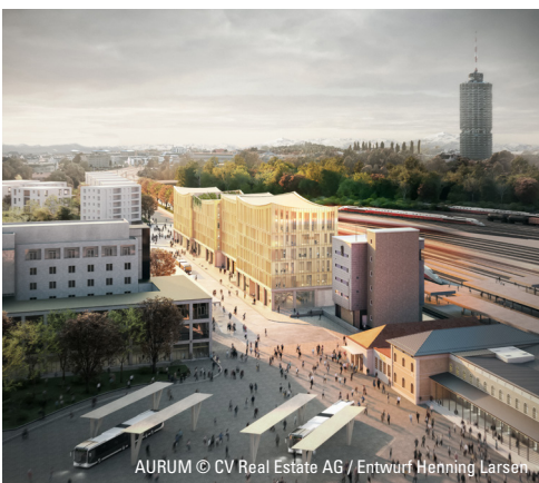
AURUM © CV Real Estate AG / Entwurf Henning Larsen