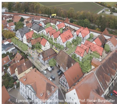
Egerviertel © Städtebauliches Konzept Prof. Florian Burgstaller