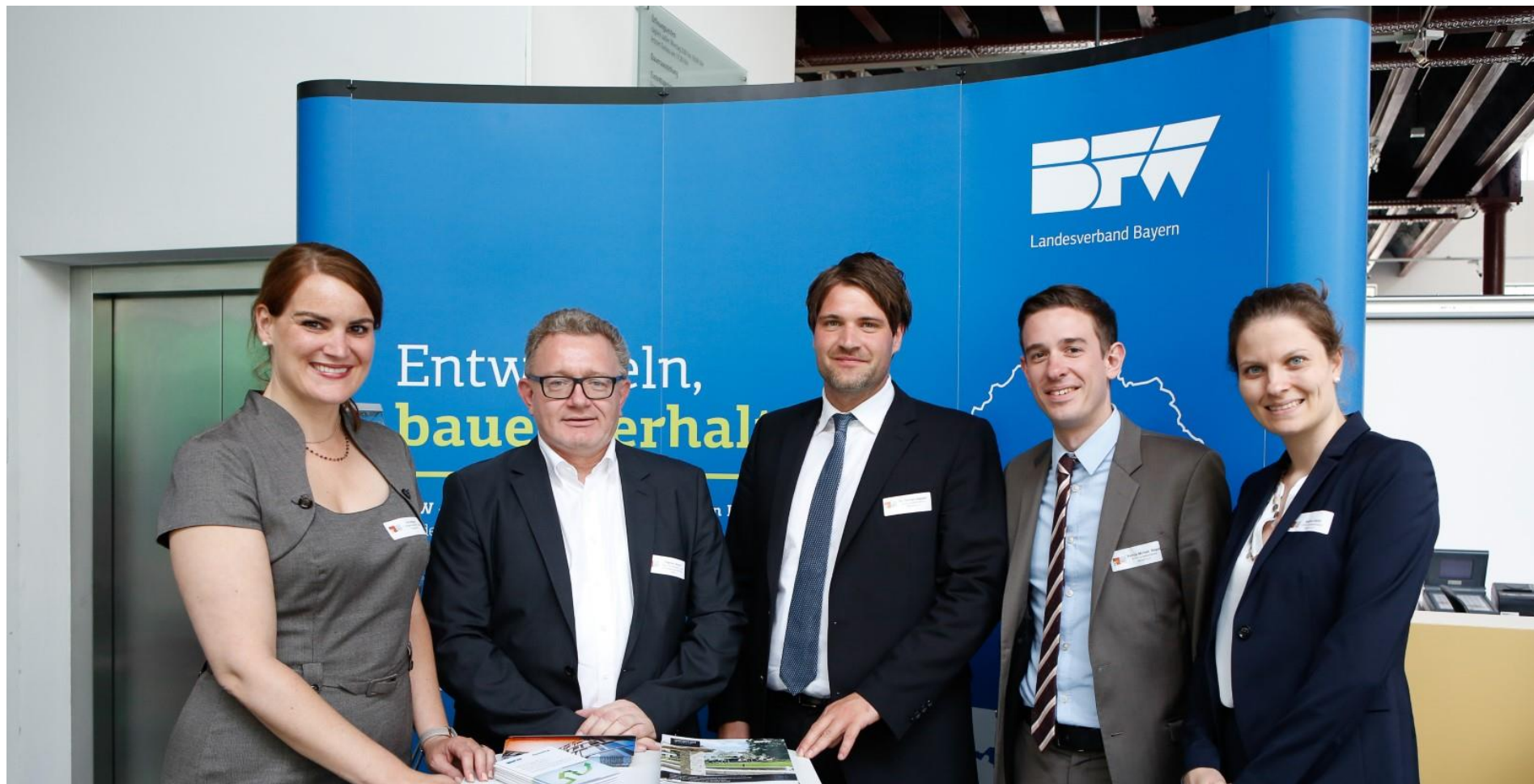
Hier: BFW Bayern e.V. mit Augsburgs Bürgermeisterin Eva Weber